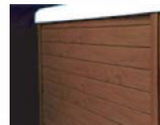
Terracina Oak & Cherry

Dimensions: 579 cm L x 229 cm W x 157 cm H